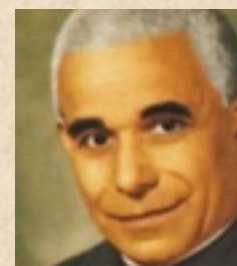
San Luigi Orione (1872 – 1940) «Nuestra caridad no cierra puertas»