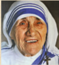
Santa Teresa de Calcuta (1917 – 1980) «La vida ha sido hecha para amar y para ser amados»