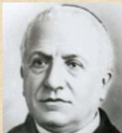
San Alfonso María Fusco (1830 – 1910) «¡Quisiera que también mi sombra pudiera hacer el bien!»