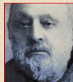
San Alberto Chmielowski (1845 – 1916) «Hay que ser buenos como el pan... que cada uno pueda tomarlo para satisfacer su propia hambre»