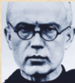
San Maximiliano María Kolbe (1894 – 1941) «Solo el Amor crea; el odio destruye»