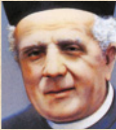
San Luigi Guanella (1842 – 1915) «...hacer la caridad es hacerla a Dios, cuyos hijos predilectos son los pobres»