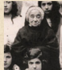
Santa Giulia Salzano (1846 – 1929) «Amar y hacer que Cristo sea conocido»