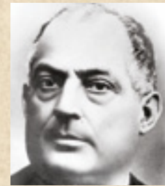
San Felipe Smaldone (1848 – 1923) «El amor debe estimular a una acción cada vez más amplia, más vasta y comprometida»